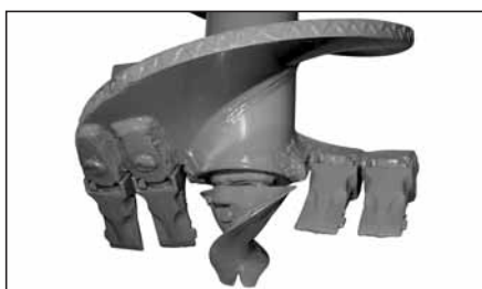
PUNTA ELICOIDALE con doppia elica, taglienti in acciaio antiusura imbullonati, per lavoro in medi terreni per mod. TR 600/1200/1500.

HELICOIDAL DRILL with double helix, steel edges anti-wear rivetted for medium grounds for mod. TR 100/180/300.