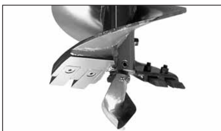
PUNTA ELICOIDALE con doppia elica, taglienti in acciaio antiusura imbullonati, per lavoro in medi terreni per mod. TR 100/180/300.

Model TR 600/1200/1500: the tools available have diameter of 200, 250, 300, 350, 400, 500, 600, 800 mm and lengths of 1000, 1500, 2000 mm.