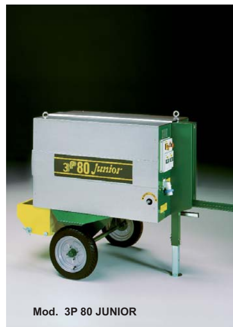
Mod. 3P 80 JUNIOR