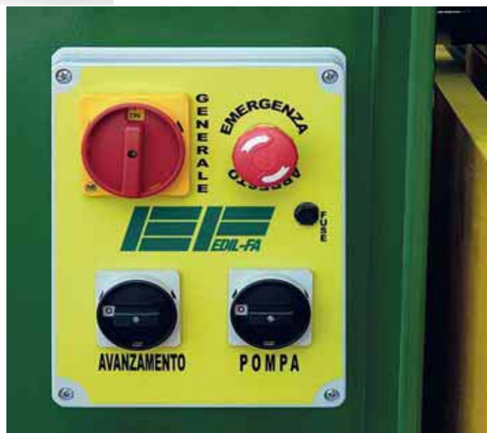
Quadro comandi con pulsante di emergenza.

La spina di alimentazione, dotata di un'invertitore di fase, consente di ripristinare il giusto senso di rotazione.