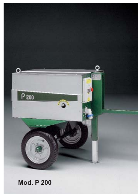
Mod. P 200