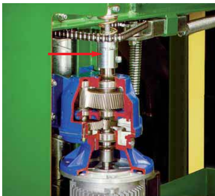
Giunto di sicurezza in versione trifase del motoriduttore coassiale.