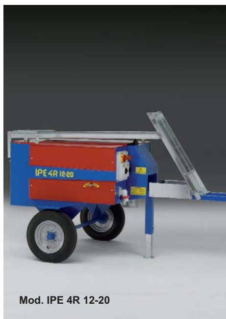
Mod. IPE 4R 12-20